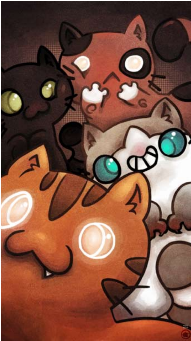
Écran de verrouillage pour smartphone.