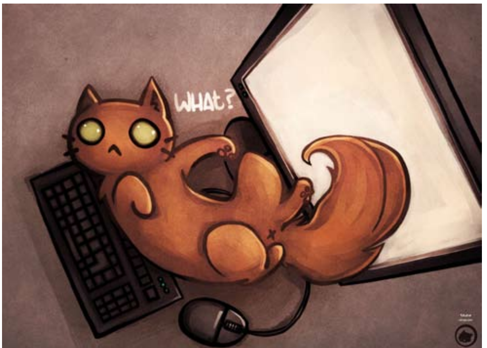
Illustration réalisée pour promouvoir mon site web : catscribble.com .