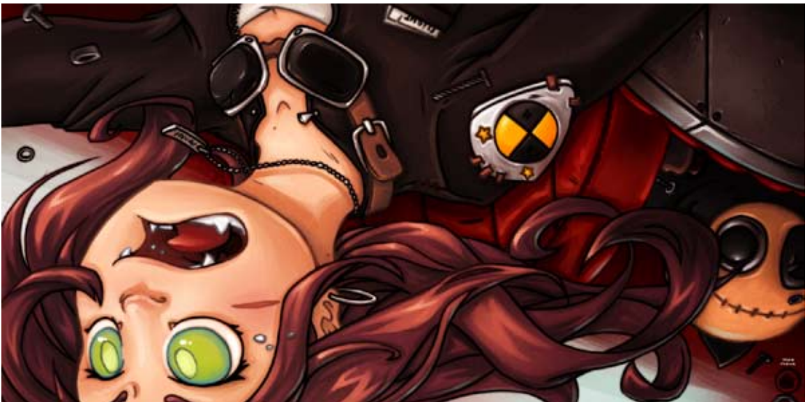
Crashtest : Character design.