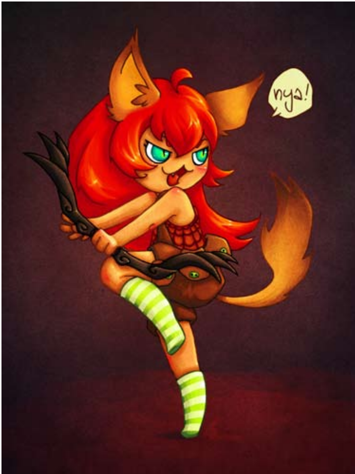
Nahoka : Inspiré du jeu vidéo TERA.