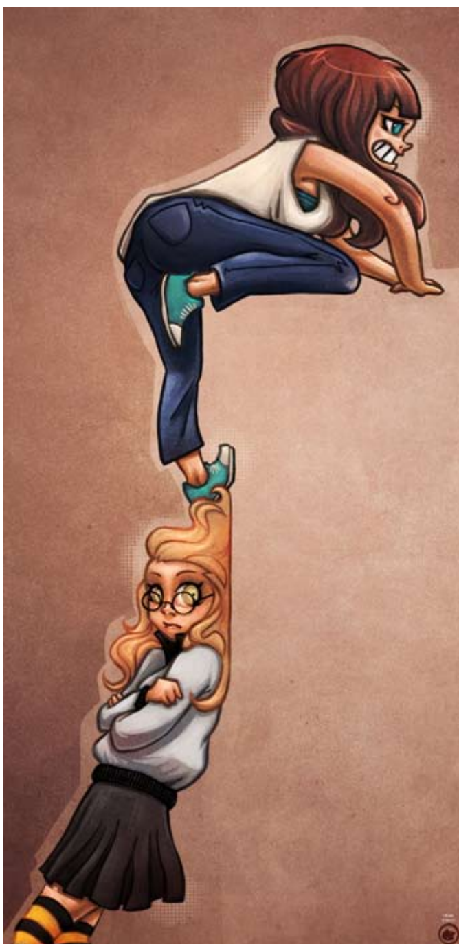
Invisible wall : Character design ayant pour thème l'escalade.