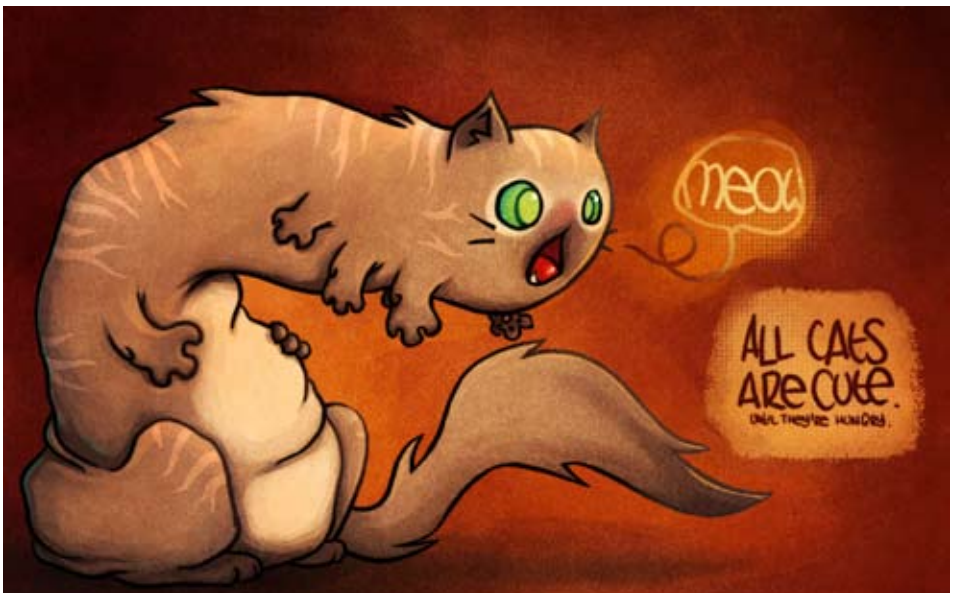
Character design : les chats-monstres.