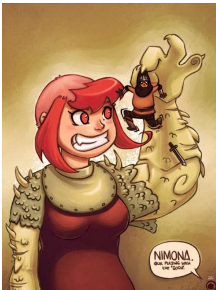
Nimona : Inspiré du webcomic éponyme de Noelle Stevenson.