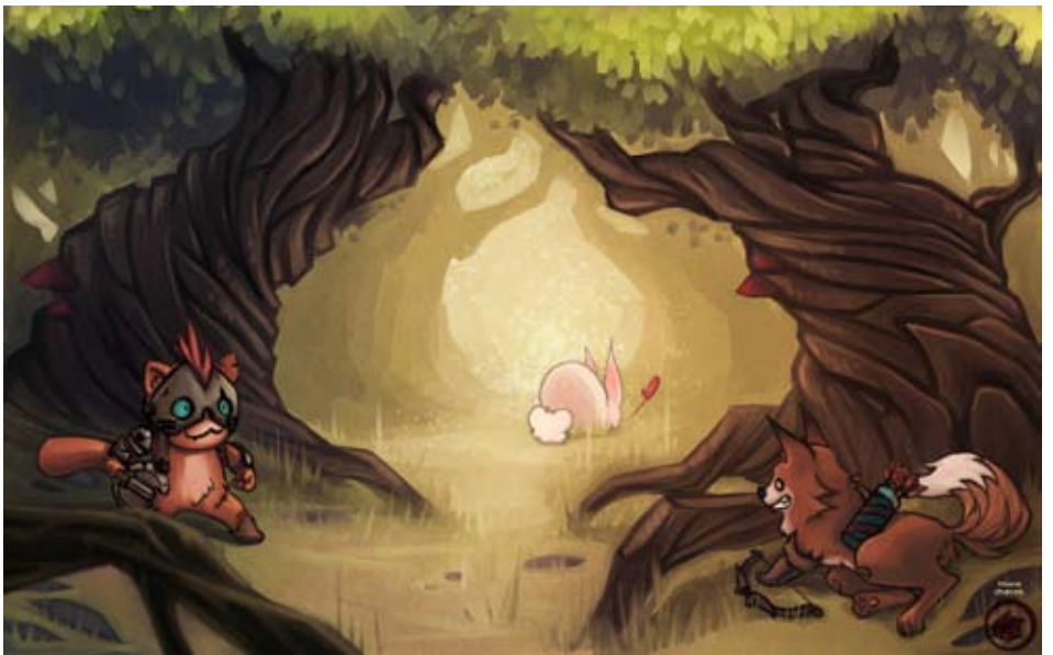
Catching the Rabbit : Character and landscape design.