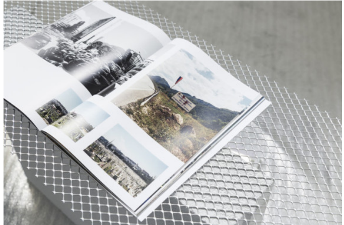
Lucia Cristiani, This will fix you, Photo Giulia Spreafico, Tspace

( http://julietartmagazine.com/wp-content/uploads/2016/11/LuciaCristiani_THISWILLFIXYOU_photoGiuliaSpreafico_tspace_MG_6303LuciaCristiani_THISWILLFIXYOU_photoGiuliaSpreafico_tspace.jpg )