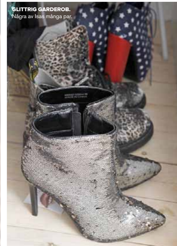
GLITTRIG GARDEROB. Några av Isas många par.