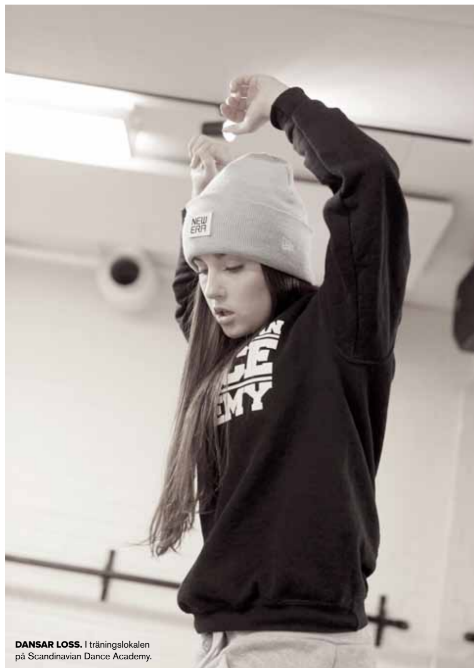
DANSAR LOSS. I träningslokalen på Scandinavian Dance Academy.